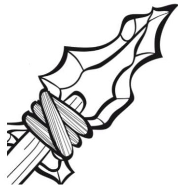
Coitelo hai miles de anos