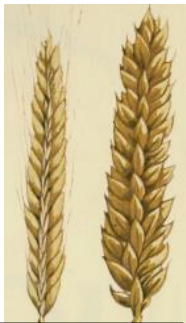
Centeo e millo

Aquelas xentes cultivaban millo, centeo, verzas, fabas e chícharos. Incluso usaban as ortigas para alimentarse, como tamén as abelás, as noces, moras e arándanos.