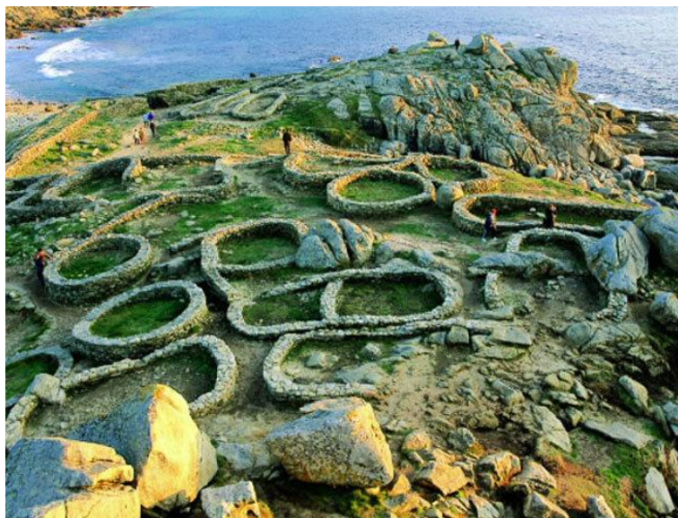
CASTRO DE BAROÑA, A CORUÑA

Dícese que os castrexos poden estar relacionados cos Celtas. Como xa sabemos, os celtas eran tribos feroces e guerreiras que viviron na época prerromana e que se asentaron no norte e no centro da Península Ibérica. En Galicia atopamos un montón de asentamentos castrexos que como xa estudáchedes, eran casas con firma circular e distribuídas de forma desordenada.